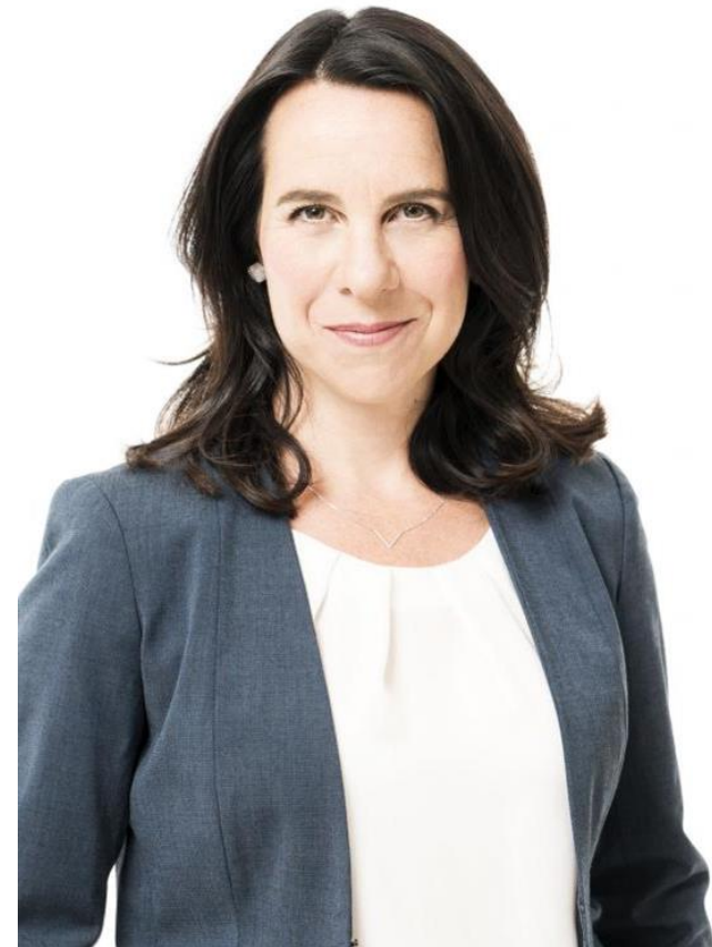
Valerie Plante, Mayor of Montreal Maire Parraine pour le Recrutement au Canada

Pour adhérer, rendez-vous sur www.citiesracetozero.org et signez l' engagement de Cities Race to Zero pour les villes.